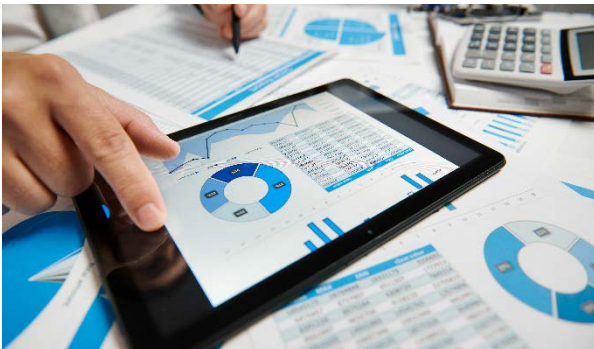
SDN Dienstleistung – Einführungs-Workshop SD-CAMPUS

Auf der Suche nach einer modernen Netzwerkinfrastruktur, die die gestiegenen Anforderungen mit den derzeitigen Ressourcen bewältigt, orientieren sich viele IT-Verantwortliche in den Unternehmen am Konzept des Software-Defined-Networking (SDN).